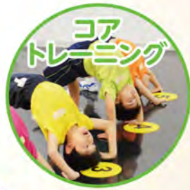
コア トレーニング