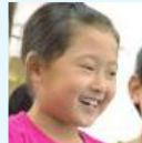
たまきちゃん(1年生)

スポーツの習い事を考えていましたがどれが娘にあっているかわからなかった為、スポーツのテクニックより先に 体を動かす楽しさやコツを身につけてほしい と思い始めました。 子ども目線でとても分かりやすく 説明、指導してくださるのでとても クラスの雰囲気がよく 、見学していて親が学ぶことも多いです。